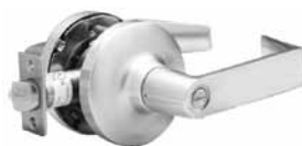
VERROUILLABLE SALLE DE BAINS BOUTON TOURNANT INTÉRIEUR