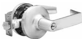
ENTRÉE ENTRÉE/BUREAU BOUTON TOURNANT INTÉRIEUR