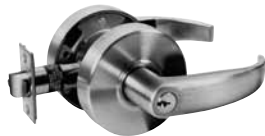
ENTRÉE ENTRÉE/BUREAU BOUTON TOURNANT INTÉRIEUR