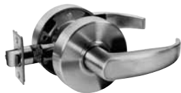
NON VERROUILLABLE VESTIBULE/PLACARD