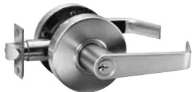
ENTRÉE ENTRÉE/BUREAU BOUTON TOURNANT INTÉRIEUR