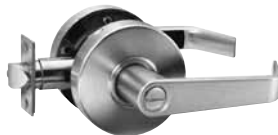
VERROUILLABLE SALLE DE BAINS BOUTON TOURNANT INTÉRIEUR