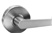
FAUSSE SERRURE LEVIER