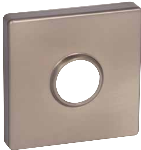
ROSETTE CARRÉE CONTEMPORAINE